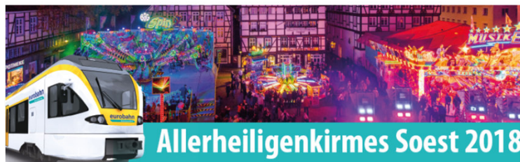
59 / RB 89: Zusätzliche Fahrten vom 07. bis 11. November