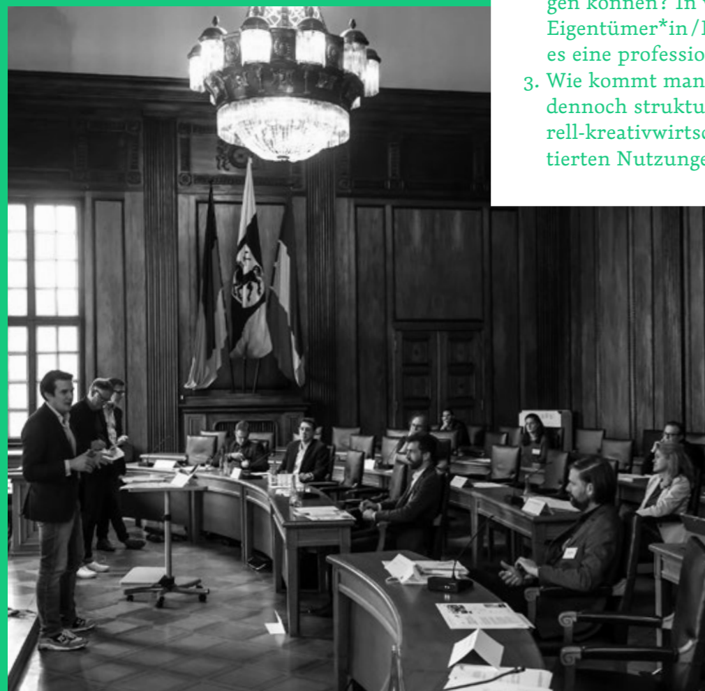
WORKSHOP »TRANSFORMATION KULTIVIEREN«

Sie will all jene an einen Tisch holen, die die Städte und Stadtgesellschaften von morgen maßgeblich mitgestalten: Die Vernetzungsinitiative »Gemeinsam für das Quartier«, versteht sich als Vermittler zwischen Stadt- und Immobilienentwicklung, Wirtschaftsförderung und kreativen Stadtmacher*innen. Gemeinsam diskutiert wurde im Rathaus.