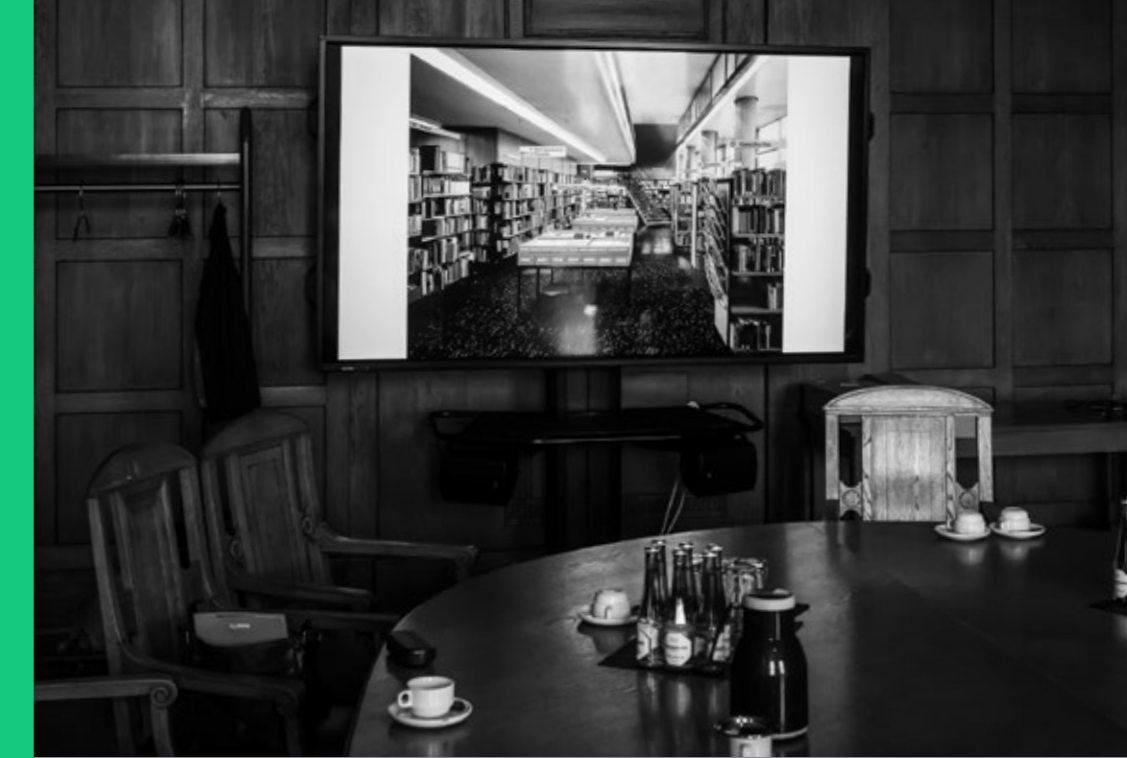
WORKSHOP »BLICK INS ARCHIV«

Es wurden eher retrospektive Bewertungen diskutiert. Haben sich die Orte durch den Abriss für die Stadtgesellschaft als lebenswerter erwiesen? Ist durch den Rückzug der Kultur Neues entstanden, oder haben die Orte