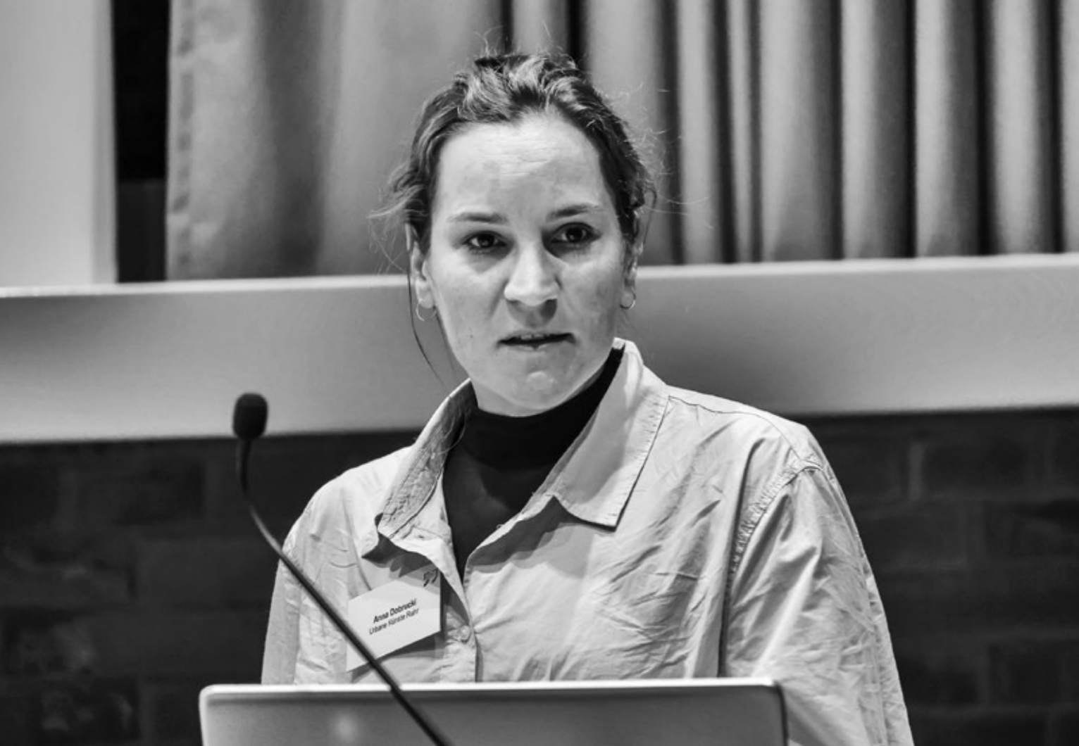
WORKSHOP »MACHT WAS AUS DEM LEERSTAND!«