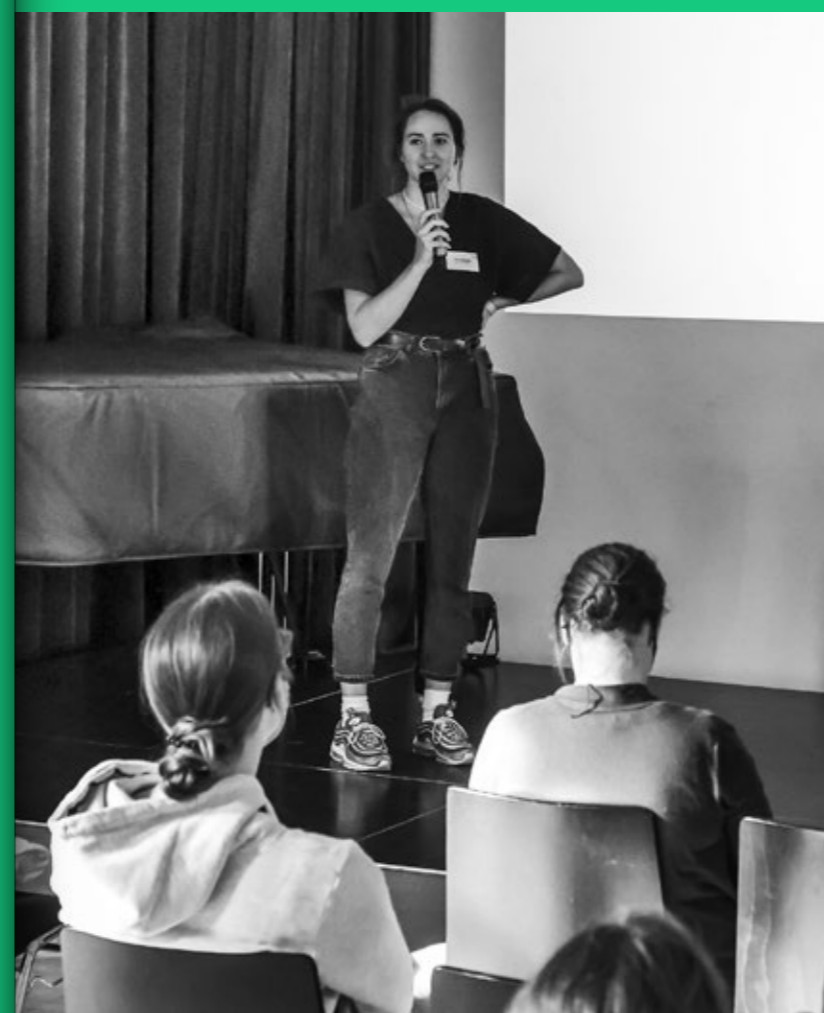
WORKSHOP »DIE ZUKUNFT DER ZENTREN IST INKLUSIV, GRÜN UND PRODUKTIV«

»AUSSER DEM WOCHENMARKT SIND AUF DEM RATHAUS- PARKPLATZ FEIERABENDMÄRKTE, KULTURVERANSTALTUNGEN UND MEHR GRÜN DENKBAR.«