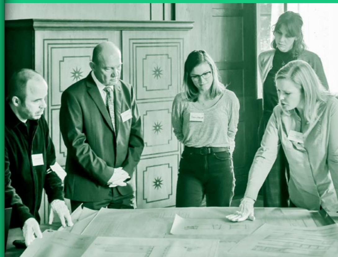
WORKSHOP »BLICK INS ARCHIV«

WEITERFÜHRENDE LINKS: www.baukunstarchiv.nrw/forschung