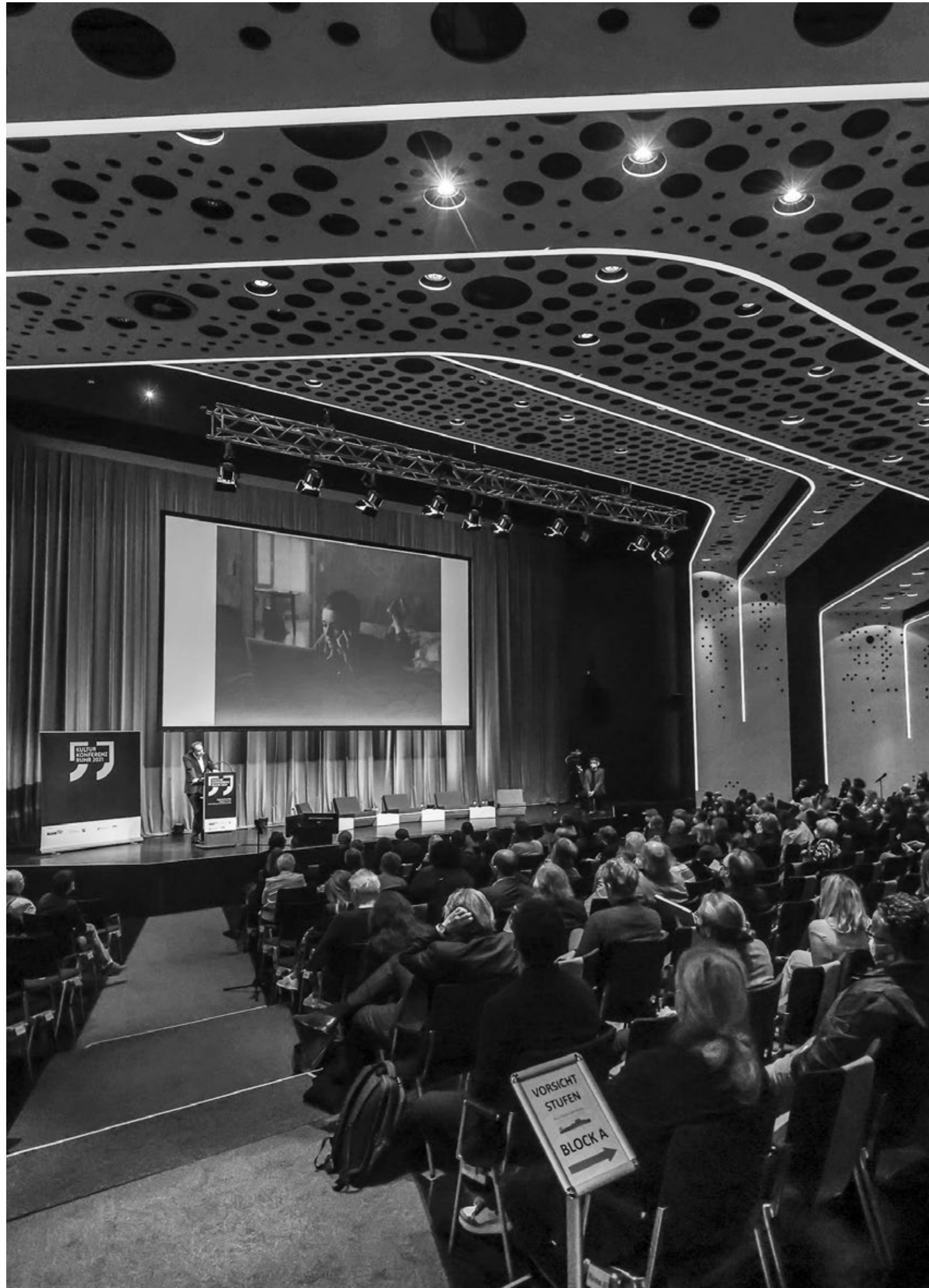
IMPULSVORTRAG NIKLAS MAAK