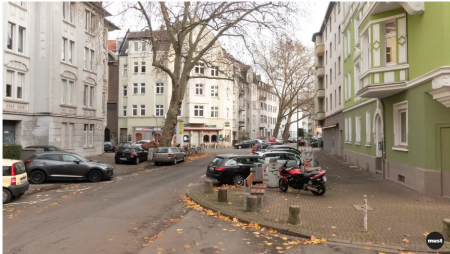
Abbildung 1: Status Quo, Projekt „Lebenswerter Neuer Graben“, Dortmund