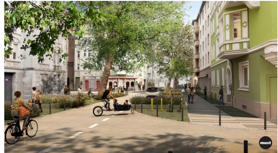
Abbildung 2: Vorzugsvariante „Lebenswerter Neuer Graben“, Dortmund