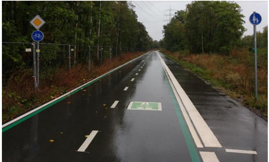
Aufnahme September 2022