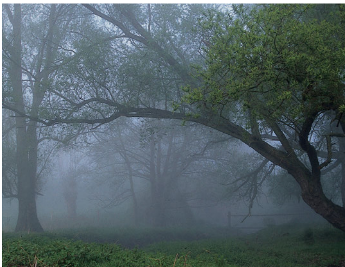
Ooilandschap Bislicher Insel

een natuurlijk hardhout- en zachthoutoobos, zoals dat vroeger langs de Rijn verbreid was. Nadat bomen die hier van nature niet thuishoren zoals bijvoorbeeld de hybride populier, zijn verwijderd, heeft in deze gebieden al jarenlang alleen de natuur het nog 'voor het zeggen'. Via de natuurlijke ontwikkeling van struikgewas door zelfuitzaaiing (successie) hebben boomsoorten als de els, es, wilg en zwarte populier zich hier alweer verspreid en vormen de basis voor het oobos dat daar van nature thuishoort. De steile oevers van de met grondwater gevulde grindgaten die in Bislicher Insel door ontgrinding zijn ontstaan, werden voor een deel afgevlakt, om in de ondiepe wateren leefruimten te