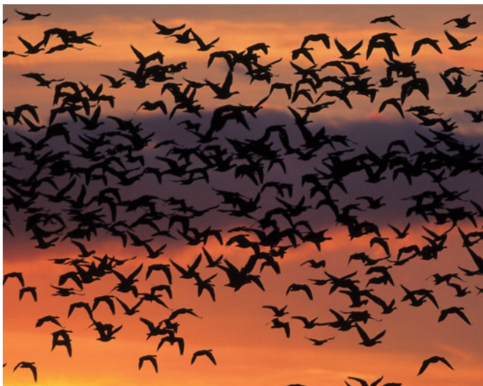
Ganzen in het avondrood

hoogwaterkanaal evenals de geplande boven- en onderstroomse verbinding met de Rijn zijn de eerste stappen al gezet om dat doel te bereiken.