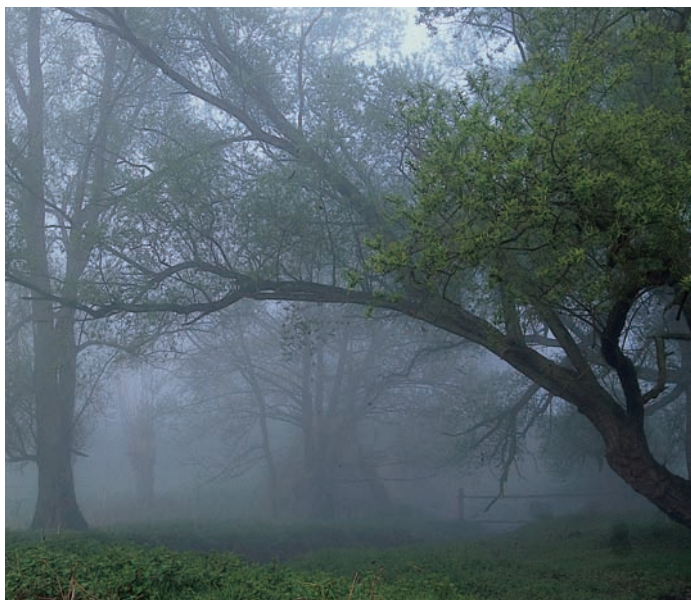
Auenlandschaft Bislicher Insel

Mit dem Neubau des rheinfernen Deichs und einer Flutmulde sowie der geplanten ober- und unterstromigen Anbindung des Rheins sind die ersten Schritte zur Erreichung dieses Ziels bereits eingeleitet worden.